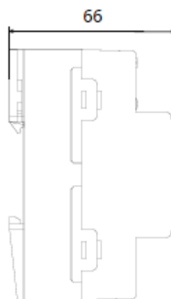
Pohled z boku