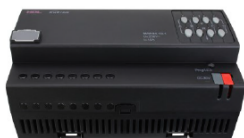
Obr. 1 Akční člen žaluziový