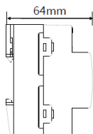
Obr. 3 Rozměry – boční pohled