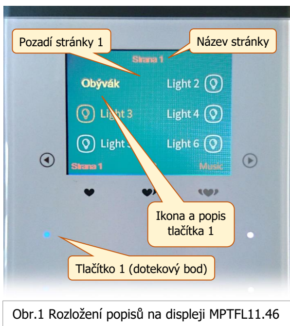
Obr.1 Rozložení popisů na displeji MPTFL11.46

Textové názvy tlačítek jsou na displeji zobrazovány ze souboru grafického formátu PNG, jsou tedy součástí obrázku, nejedná se o uložení textu ve formě znaků. To samé se vztahuje na názvy stránek, viz obr.1